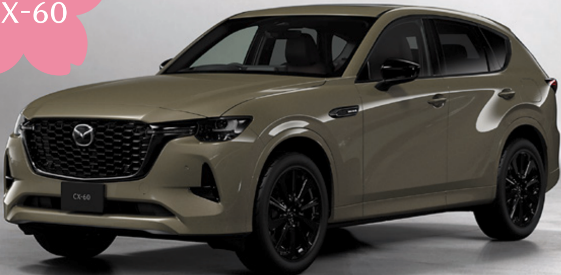
Photo: XD HYBRID Drive Edition Burgundy Leather Package Body Color: ジルコンサンドメタリック